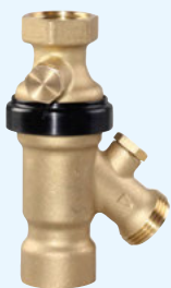
Systemtrenner EWE DN 20 / DN 40 0855302 35,00 €*