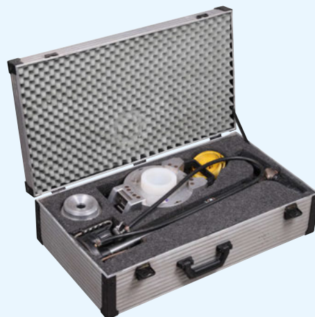
Friatop Aufspannvorrichtung Top-Loading L-6127598 75,00 €*