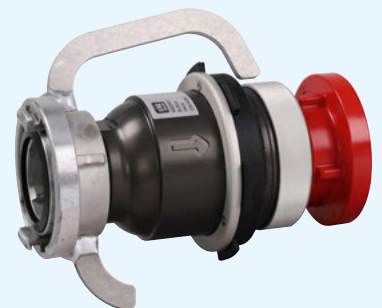
Feuerwehr-Systemtrenner B-FW Typ EWE 0855305 35,00 €*