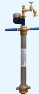
Standrohr ohne Systemtrenner BA 0855015 99,00 €*