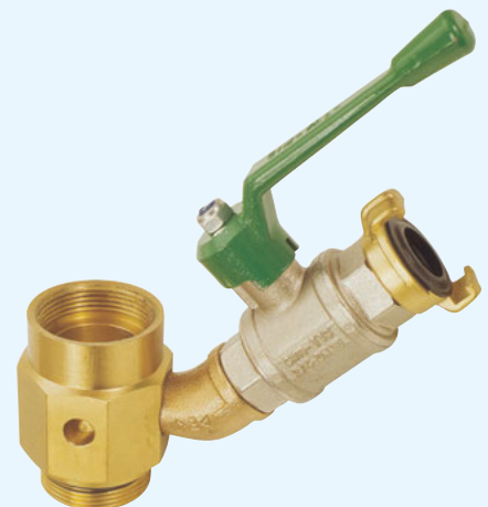
Spülstück, für seitliche Anbohrung und Kera-Anbohrarmatur L-1130414 30,00 €*