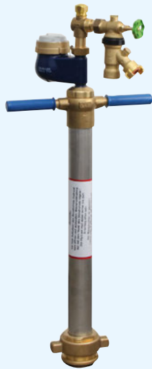
Standrohr Q 3 4 für UFH DN 80 1 Auslaufventil BA, mit Geka L-1172048 100,00 €*