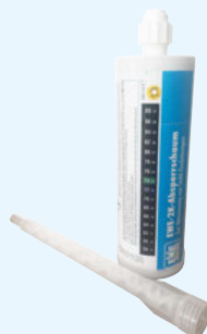
Erforderliches Schulungsmaterial: 2K-Absperrschaum 380 ml Kartusche 6120391 290,55 €