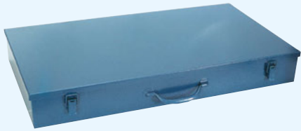
Anbohrgerät-Set, für Ventil-Anbohrarmatur L-6100100 90,00 €*