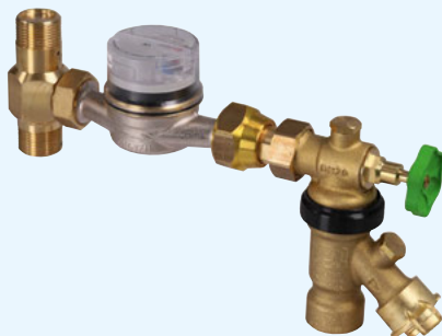
Bau-Wasserzähler 0855019 75,00 €*