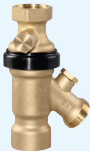
Systemtrenner EWE DN 20 x 1" 0855300 30,75 €