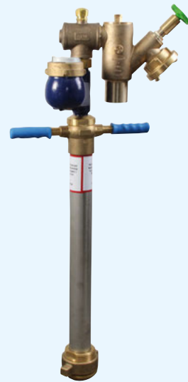
Standrohr Q 3 10 für UFH DN 80 1C-Abgang BA L-1173848 100,00 €*