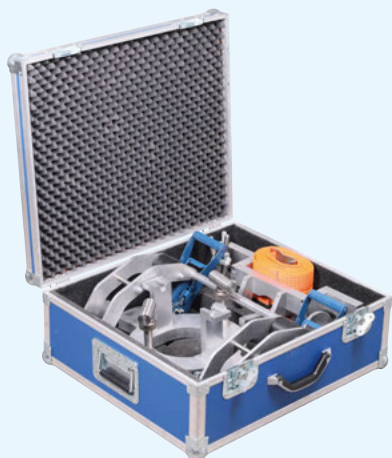
Spannvorrichtung Top-Load 630 +GF+ L-6127597 75,00 €*