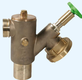
Systemtrenner EWE DN 40 x 2" 0855301 30,75 €