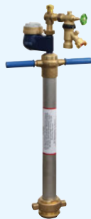
Standrohr mit Systemtrenner BA 0855014 148,00 €*