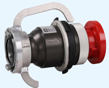
Feuerwehr-Systemtrenner B-FW Typ EWE 0855304 25,00 €