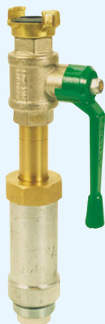
Spülarmatur, für Ventil-Anbohrarmatur L-1130112 30,00 €*