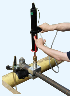
Nachschulung 2K-Absperrschaum 0855050 500,00 €