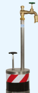
Schachthydrant 0855020 148,00 €*

* Kostenvoranschläge inklusive Kleinteile und Arbeitsaufwand für die Reparatur, ohne benötigte Reparatur-Teile