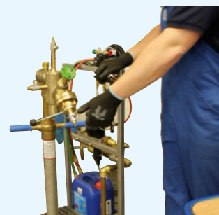
Schulung Systemtrenner 0855050 500,00 €